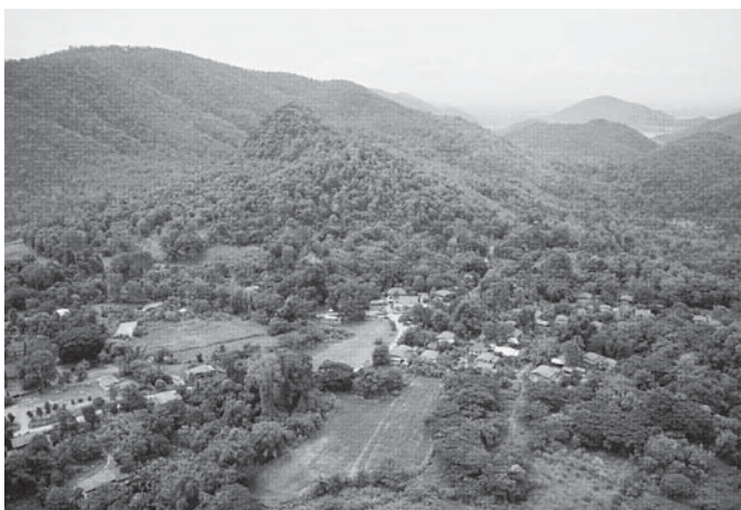
รูปที่ 1 พื้นที่อยู่อาศัยและสภาพป่าของบ้านป่าสักงาม

3) เขตพื้นที่ในการวิจัยครั้งนี้คือ บ้านป่าสักงาม ตำบลลวงเหนือ อำเภอตอยสะเกิด จังหวัดเชียงใหม่ ซึ่งครอบคลุมพื้นที่ในเขตป่าสักงามประมาณ 500 ไร่ พื้นที่ล้อมรอบไปด้วยเขตป่าสงวนแห่งชาติป่าขุนแม่กวง (รูปที่ 1) โดยมีเนื้อที่ประมาณ 31,875 ไร่ หรือ 51 ตารางกิโลเมตร