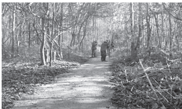
รูปที่ 2 การจัดทำแนวป้องกันไฟป่า

4. ปลูกต้นไม้เพิ่มในพื้นที่ป่าชุมชน โดยคณะกรรมการเป็นแกนนำในการจัดกิจกรรมและขอรับการสนับสนุนต้นกล้าจากศูนย์เพาะพันธุ์ไม้จังหวัดลำพูน คณะกรรมการป่าชุมชนดำเนินการประชาสัมพันธ์ผ่านหอกระจายเสียงหมู่บ้านเพื่อชักจูงให้ประชาชนเข้ามาร่วมกันปลูกต้นไม้ ซึ่งจะทำในโอกาสวันสำคัญ เช่น วันเฉลิมพระชนมพรรษา วันสิ่งแวดล้อม หรือวันมาฆบูชา เป็นต้น