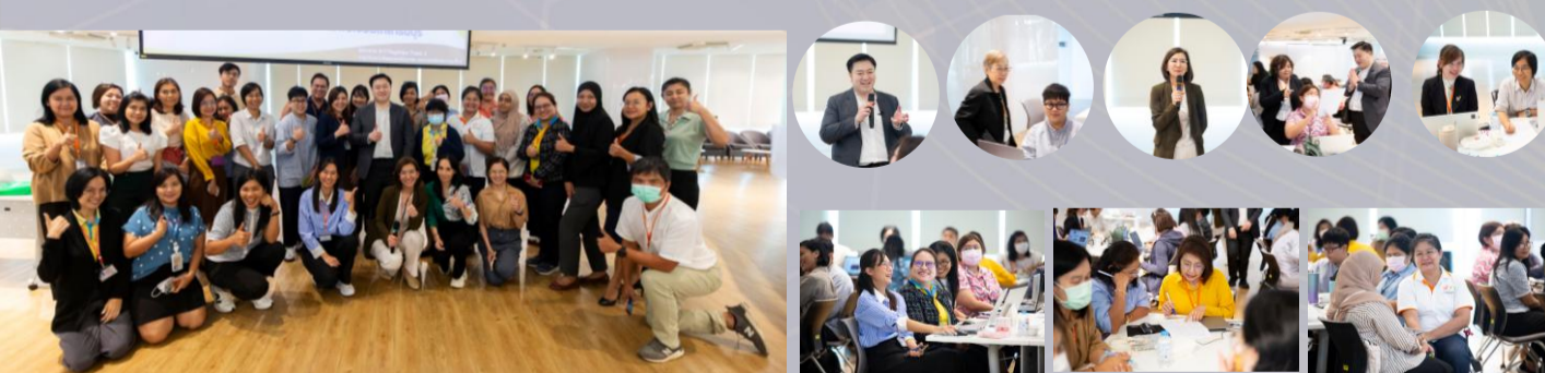
คณะทำงานกลุ่มย่อย ภายใต้โครงการ 6+1 Flagships Track 2 กลุ่มนักวิเคราะห์แผน งบประมาณและการบริหารความเสี่ยง

https://kmutt.me/mc-risk-management-poster